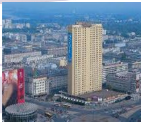
Novotel Warszawa Centrum

Adress: Marszałkowska 94, 00-510 Warszawa, Polen Telefon: +48 22 596 00 00 https://www.accorhotels.com/gb/hotel-3383-novotel-warszawa-centrum/index.shtml